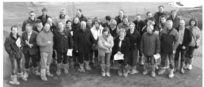
DAIRYMAN Team während dem ersten Meeting in den Niederlanden

Weitere Informationen finden Sie ab März 2010 auf unserer Internetseite www.interregdairyman.eu